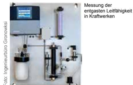
Messung der entgasten Leitfähigkeit in Kraftwerken